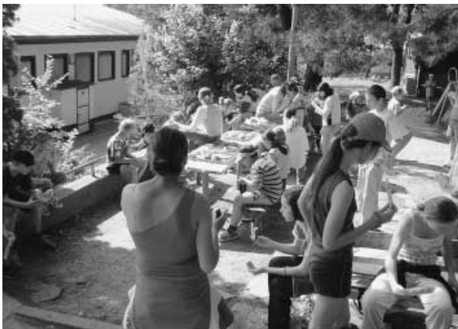
Občerstvenie sa chladným melónom je nielen príjemné, ale i chutné

Rekreačnú časť sme realizovali formou športovo kultúrnych podujatí. Jej úlohou nebola iba prezentácia možností využívania voľného času, ale aj ich prezentácia ako potreby uvoľňovacích a relaxačných techník. Boli vhodne zaradené do denného programu ako skupinové a individuálne športy, kúpanie, turistika, spoločenské hry, diskotéka, maškarný karneval či jazda na koni.