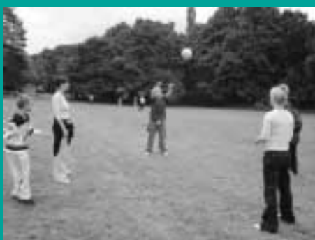
Športové popoludnie, príprava na volejbal

Už prvý deň niektorí účastníci reagovali na skutočnosť, že sú s nami i deti, ktoré inak komunikujú, reagujú a pohybujú sa. Bola to však úplne prirodzená reakcia, ktorá len potvrdila to, že deti sú veľmi všímavé a vnímajú každú zmenu okolo seba a tiež si na túto skutočnosť veľmi rýchlo zvykli. Bolo zaujímavé pozorovať, ako sa deti k sebe navzájom správajú, ako rýchlo sa nau-