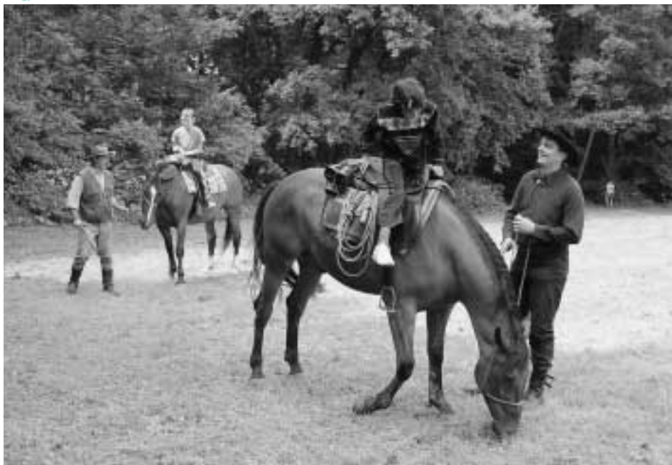
Každé dieťa sa povozilo na koni