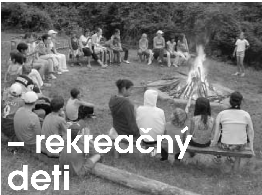
Táborák a opekanie špekáčikov

|| Tábor sa uskutočnil v rekreačnom stredisku SKALIČAN v Zlatníckej doline pri Skalici v termíne od 22. 7. 2005 do 31. 7. 2005. Išlo už o 11. ročník. V tomto ročníku ako účastníci tábora boli po prvý raz do realizácie zapojené deti s ťažkým zdravotným postihnutím – dôvodom bola veľmi dobrá skúsenosť z minulého roku, keď sa tábora skúšobne zúčastnilo jedno dieťa sluchovo postihnuté, ako i na základe skúseností z realizácie športovo-zábavného dňa pre postihnuté deti.