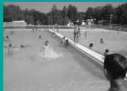
V horúčave to bez kúpania nejde

Tak, ako to už v táboroch býva, boli pre deti pripravené rôzne súťaže, či už vedomostné alebo športové, jazda na koni, turistika, kúpanie, opekanie, diskotéky... Priznám sa, že sama som si myslela, že deti s handicapom niektoré veci nezvládnu, že pri súťažiach, aby mali šancu umiestniť sa a dostať cenu je potrebné brať ohľad na ich handicap, byť miernejší pri hodnotení výsledkov, „prizmúriť oko“ a možno pridať aj trochu súcitu, ale veľmi ma potešilo, keď som zistila že som sa mýlila a nič z toho nebolo treba. Tieto deti zvládali úplne všetko ako všetky