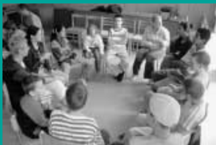
Práca v skupine

Ako pracovníčka oddelenia peňažných príspevkov na kompenzáciu sociálnych dôsledkov ťažkého zdravotného postihnutia už štvrtý rok úzko spolupracujem s oddelením sociálnoprávnej ochrany detí a rodiny pri realizácii detských táborov, a to nielen pri príprave, ale i osobnou účasťou v tábore ako vedúca skupiny.