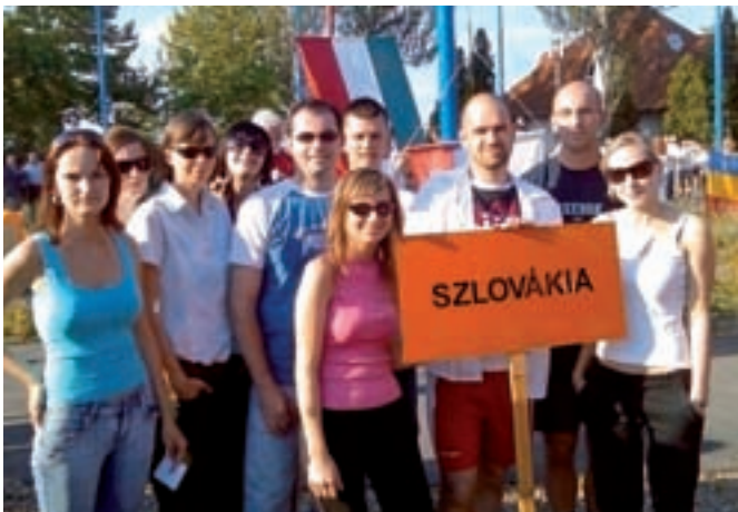
Zástupcovia ÚPSVR SR na športových hrách v Maďarsku

Tzv. Fonyódske športové dni sa konali na južnom brehu Balatonu v dňoch 1. až 3. júna 2007 a zúčastnilo sa ich viac ako 800 účastníkov. Podujatie tohto druhu má dlhoročnú tradíciu, čo dokumentuje aj fakt, že maďarské služby zamestnanosti si merajú sily na športoviskách už 16. rok a pravidelne sa ho zúčastňujú zamestnanci z jednotlivých