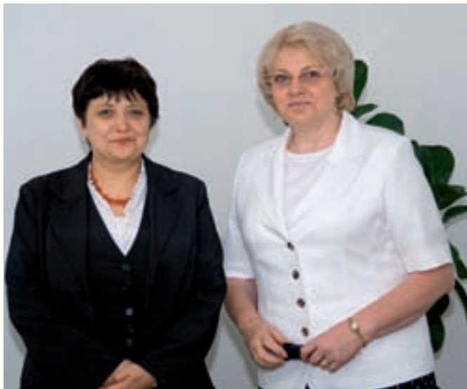
Ministerka práce, sociálnych vecí a rodiny SR Viera Tomanová prijala ministerku vlády Českej republiky pre oblasť ľudských práv a národnostných menšín Džamilu Stehlíkovú (vľavo), ktorá mala záujem hovoriť o otázkach, úlohách a skúsenostiach Slovenska v oblasti ľudských práv a národnostnej politiky, predovšetkým politiky vlády SR vo vzťahu k rómskej menšine