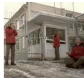
2. miesto, Better together (Litva)