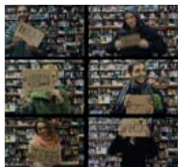
3. miesto, What does being an EU citizen mean? (Portugalsko)