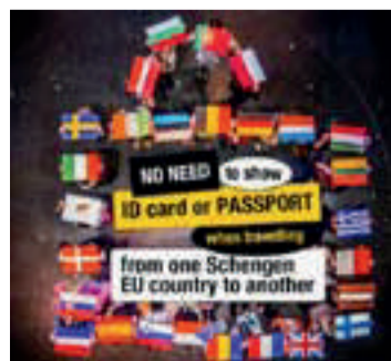
1. miesto, EU27 (Estónsko)

Úspech tohto druhého ročníka prekonal všetky očakávania. Jeho rozmer nám najlepšie pomôže pochopiť pár čísel: