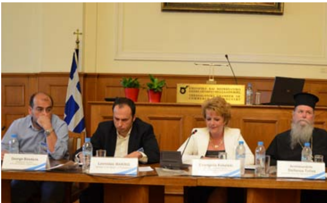
Účastníci konferencie na tému „Dosah krízy na gréckych občanov: napredovanie smerom k hospodárskej obnove“