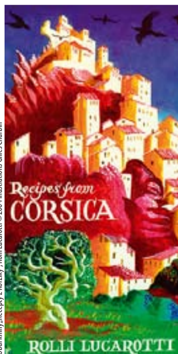
Obal knihy „Recepty z Korziky“ Rolli Lucarotti © 2004, illustrations Gilles Charbin

Prídte a vychutnajte si s nami tento kulinársky zážitok 18. júla o 12.30 hod. (sídlo EHSV, terasa na šiestom poschodí). (sb)