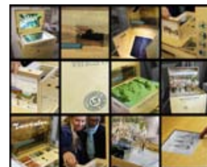
© Ministerstvo zahraničných vecí Litovskej republiky

sebadôveru a solidaritu. Napokon, za svoju budúcnosť sme zodpovední všetci.