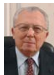
Jacques Delors, bývalý predseda Európskej komisie

„Nastal čas premyslieť našu energetickú stratégiu s plným zapojením širokej verejnosti. Kľúčom k demokracii je informovaná verejnosť, ktorej názory sú rešpektované.“