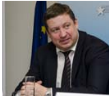
Raimundas Karoblis, stály predstaviteľ Litvy pri EÚ

Vyhlasenie Raimundasa Karoblisa, stáleho predstaviteľa Litvy pri EÚ