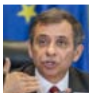
Henri Malosse, predseda EHSV

Euroskepticismus zapúšťa korene a proti európsky naladené strany podľa prieskumov napredujú. Len 30 % Európanov má ešte stále pozitívnu mienku o Európskej únii, čo je alarmujúci údaj vzhľadom na blížiaci sa európske voľby, ktoré sa uskutočnia o rok – 25. mája 2013.