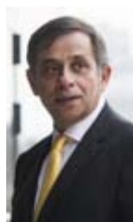
Henri Malosse, predseda EHSV

Znenie vyhlásenia bolo predložené Európskej rade krátko pred jej májovým zasadnutím zameraným na energetiku. Jeho hlavná myšlienka nadväzuje na opakované výzvy EHSV na otvorenie európskeho energetického dialógu, ktorý by sieťam občianskej spoločnosti a verejnosti umožnil rokovať s rozhodujúcimi činiteľmi a zabezpečil by koordinovanú, viacúrovňovú komunikáciu v rámci členských štátov i medzi nimi navzájom. (mb)