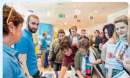
Počas Dňa otvorených dverí privítal EHSV okolo 2580 návštevníkov

Deň otvorených dverí splnil očakávania návštevníkov vyjadrené v jeho mottu: „Porozprávajme sa o Európe!“ (fgr)