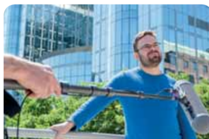
Návštevníci mali možnosť nahrať videoodkaz pre novozvolený Európsky parlament so svojimi želaniami a požiadavkami

Keďže sa podujatie konalo len niekoľko dní pred voľbami do Európskeho parlamentu, návštevníci mali možnosť nahrať svoj videoodkaz a novozvoleným poslancom Európskeho parlamentu adresovať svoje želania, očakávania a požiadavky týkajúce sa troch hlavných tém: Európa rastu, Sociálna Európa a Udržateľná Európa . Tieto videoodkazy sú už dostupné on-line na našej internetovej stránke a budú doručené novému Európskemu parlamentu, aby na ne zareagoval a konal! Pri tejto príležitosti bolo pripravených množstvo aktivít, hier a zaujímavostí pre celú rodinu.