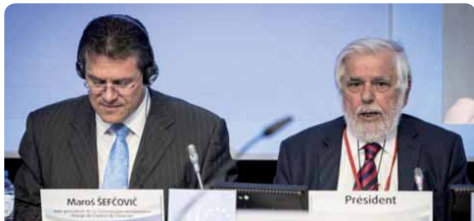
podpredseda Komisie Maroš Šefčovič a predseda EHSV Georges Dassis