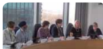
Rozšírené užšie predsedníctvo skupiny Pracovníci s britskými odborármi v Londýne

EHSV sa spojil s Európskou komisiou v snahe zaručiť, že táto konzultácia bude zohľadňovať aj názory občianskej spoločnosti. Výbor je odhodlaný tento proces sledovať a uistiť sa, že nový pilier sa bude v praxi uplatňovať pomocou primeraných právne záväzných nástrojov, pretože to je jediná cesta, ako dosiahnuť v Európe sociálny pokrok. (cad)