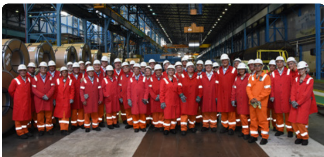
Konferenciu spoločne zorganizovali skupina Zamestnávateľia a slovenská Republiková únia zamestnávateľov

European Economic and Social Committee Európsky hospodársky a sociálny výbor