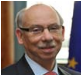
Janusz Lewandowski, člen Komisie zodpovedný za finančné plánovanie a rozpočet

Napriek kompromisom a niekoľkým škrtom, cieľnejší rozpočet EÚ pomôže miliónom Európanov, povedal Janusz Lewandowski, člen Komisie zodpovedný za finančné plánovanie a rozpočet